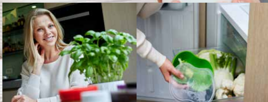
"Basilicum op de vensterbank: eerst decoratief, daarna lekker in een verse pesto."

"Koken met restjes, daar worden wij blij van."