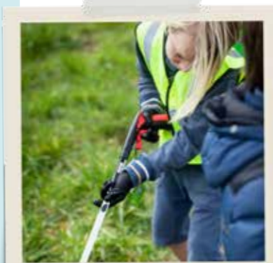
Ook tijdens de handhavingsweek zijn er vrijwilligers actief om zwerfvuil op te ruimen.