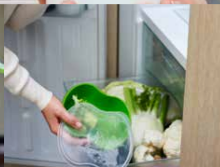
"Ik hou niet van een wildgroei van producten in mijn frigo."