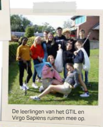
De leerlingen van het GTIL en Virgo Sapiens ruimen mee op.